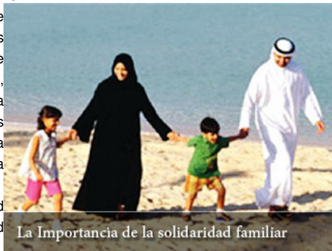
La Importancia de la solidaridad familiar

¿No es acaso la sociedad islámica sino una sociedad